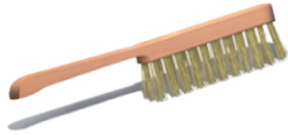
Bàn chải sắt