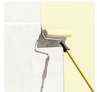
Bước 4: Thi công lớp thứ 2