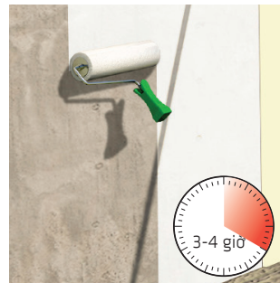
Bước 3: Thi công lớp thứ 1 chờ khô trong khoảng 3-4 tiếng