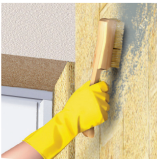
Bước 1: Vệ sinh, xử lý bề mặt bê tông, vữa